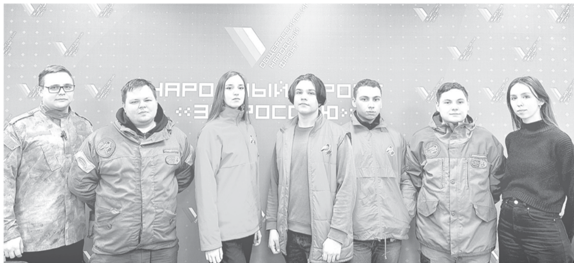
Молодёжь Общероссийского Народного Фронта поддерживает бойцов в зоне спецоперации