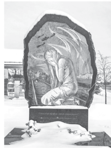
■ Памятник детям, погибшим в годы войны в Тихвине

— Я бы, наверное, сказал «Бог в помощь им». Чтобы наши священнослужители больше молились за них, за их семьи. Ведь сегодня дух каждого человека, его настрой — это очень важно. Хочу, чтобы они вернулись в свои семьи с гордо поднятой головой. И уже оставались бы защитника-