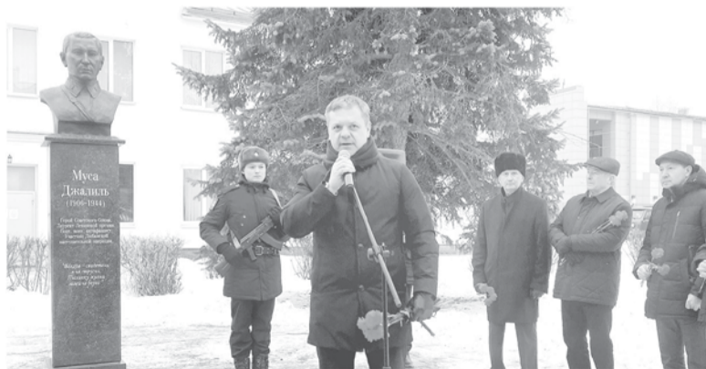
Памятник Мусе Джалилю в Тосно установили на средства Татарского общества

День защитника Отечества — это и день памяти героев, которые защищали нашу землю в годы Великой Отечественной войны. В их рядах — поэт-антифашист, военный корреспондент Муса Джалиль, служивший политру-