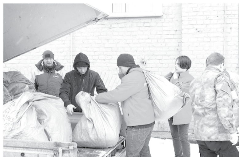
В сборе гуманитарных грузов участвуют представители бизнеса и граждане