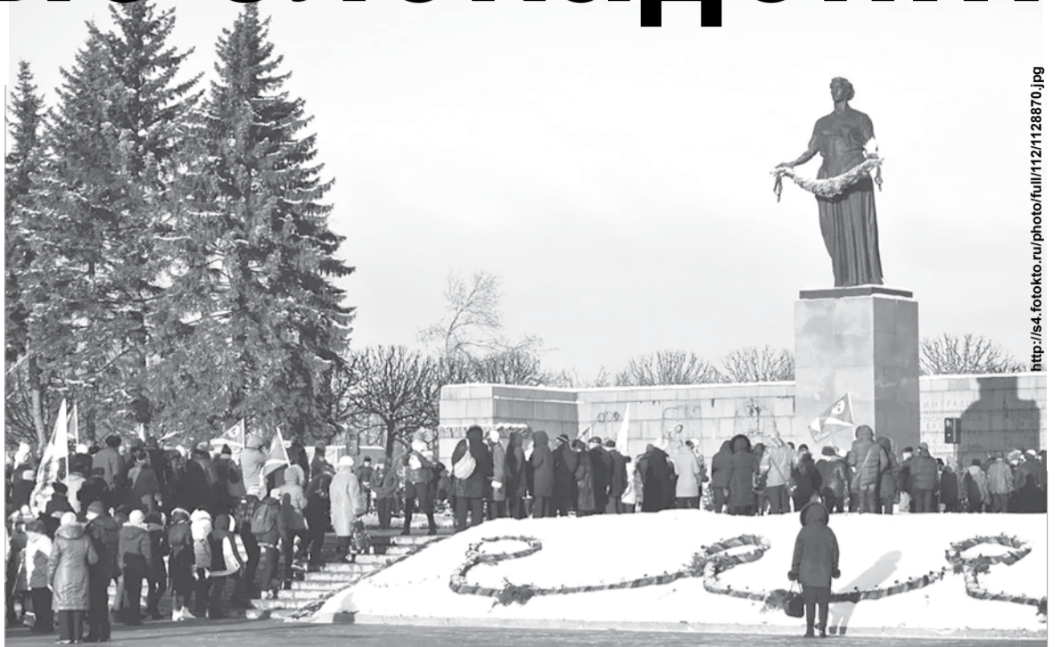
На Пискарьевском мемориальном кладбище

Наряду с Маршалами СССР Л.А. Говоровым и К.А. Мерцковым он является главным политическим организатором и вдохновителем Ленинградской победы. Я считаю, что давно пришло историческое время воздать должное выдающимся заслугам А.А. Жданова перед ленинградцами, Ленинградом и Родиной!