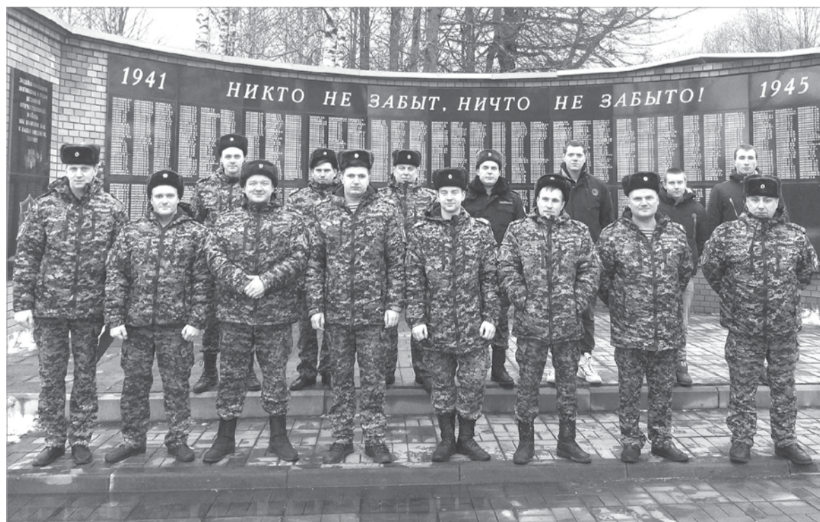
Сотрудники МОВО по Лодейнопольскому району

Пресс-служба вневедомственной охраны по СПб и ЛО